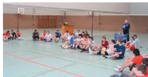
Die Regeln werden verkündet...

Doch zunächst musste Einiges erledigt werden. Die SMV begann nach sechs harten Schulstunden mit dem Aufbau und mit den üblichen organisatorischen Dingen. Nachdem alle drei Netze aufgebaut waren, ging es ans anfertigen der Spielpläne – es galt 11 Mannschaften aufzuteilen und geregelt gegeneinander spielen zu lassen.